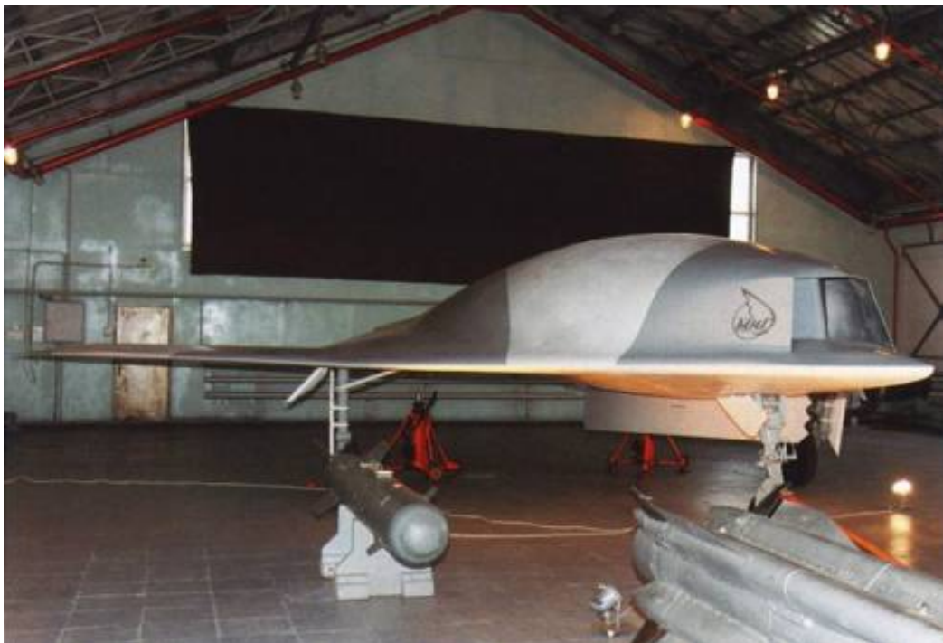
Рисунок 8. ББС «Скат»

Поведение европейских разработчиков легко объяснить. Пропустив самостоятельное создание боевых самолетов 5-го поколения, страны Европы оказались перед угрозой потерять технологический уровень своей авиационной промышленности. Отказ европейских разработчиков поддержать предложенную американцами системную концепцию беспилотной боевой авиации сыграл свою роль в прекращении программы J-UCAS.