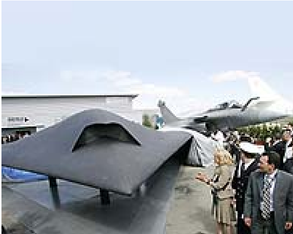
Рисунок 6. БЛА Neuron

международных выставках европейцы «ответили» американцам демонстрацией своих собственных разработок ББС аналогичной весовой категории, что и разрабатываемые в США в рамках программы J-UCAS беспилотные боевые самолеты X-45С и X-47В. Сначала это были разработки ББС Neuron (Рисунок 6) и Taranis (Рисунок 7), проводимые в рамках программы NEURON и SUAVE. На выставке МАКС в 2007 году их дополнил российский проект ББС «Скат» (Рисунок 8) разработки РСК «МиГ».