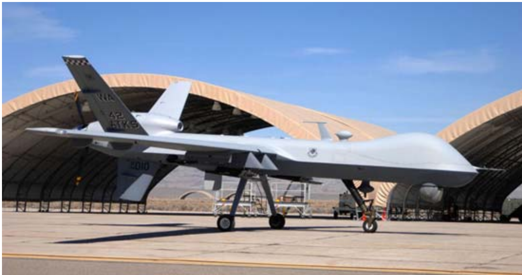
Рисунок 3. БЛА Reaper

Следует упомянуть, что именно в рассматриваемый период в США на вооружение был принят разведывательно-боевой вариант информационного БЛА «Predator» – так называемый «Вооруженный Predator», получивший в американских ВВС обозначение MQ-1. И в составе ВВС США появилось специальное подразделение, 432 авиакрыло Hunter, с несколькими комплексами таких ББЛА. Однако появление этого ББЛА исторически является шагом в развитии не беспилотной боевой авиации, а качественно нового вида сухопутных систем вооружения, получивших в отечественной практике обозначение беспилотных авиационных комплексов боевого применения. Очевидно, что вектор того развития беспилотных летательных аппаратов, который обозначило появление «Вооруженного БЛА Predator», лежит в иной плоскости, чем вектор развития беспилотной боевой авиации. Это следует из сравнения технического облика MQ-1 и последовавших за ним ББЛА Warrior и Reaper, отличающихся очень малой скоростью полета, в связи с оптимизацией их технического облика на режим барражирования, с тем, что понимается в тех же США под беспилотным боевым самолетом.