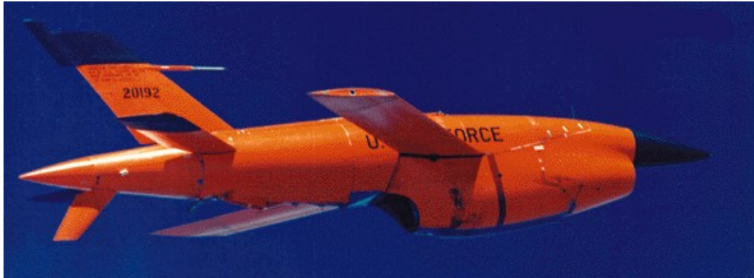
Рисунок 1. BQM-34 Firebee

сверхмалого калибра, должны были начать после этого самостоятельные действия по атаке наземных целей. Один из самолетов Raptor (предполагается, что это будет двухместный вариант истребителя F-22) будет исполнять при этом роль авиационного командного пункта, другой – роль самолета прикрытия от истребителей противника. Разработку аналогичного ББС, получившего обозначение «Скитер», вела и фирма Boeing. Все рассмотренные примеры относятся к ББС мобильного базирования с воздушным стартом.