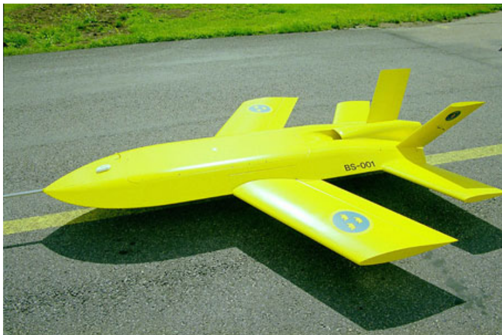
Рисунок 2. БЛА Sharc

Однако американский «катализатор» процесса развития беспилотной боевой авиации и разработки ББС возымел свое действие. И в Европе на выставочных экспозициях в это время уже начали демонстрироваться перспективные разработки ББС. Это проект Sharc (Рисунок 2) шведской фирмы SAAB, перспективный ББСUCAV европейского концерна EADS, первые варианты технического облика ББС Grand Duc, инициативную разработку которого начала французская фирма Dassault, и проект ББС Sky-X разработки итальянской фирмы Alenia. А в 2005 году к ним добавился проект ББС «Прорыв-У» разработки ОКБ им. А.С. Яковлева. И это все ББС большой размерности, рассчитанные на стационарное базирование с использованием той же технической инфраструктуры, что используют обычные боевые самолеты.