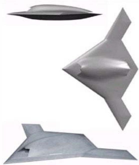
Рисунок 5. БЛА X-47В