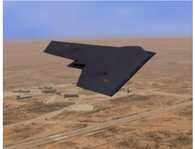
Рисунок 7. БЛА Taranis

Поведение европейских разработчиков легко объяснить. Пропустив самостоятельное создание боевых самолетов 5-го поколения, страны Европы оказались перед угрозой потерять технологический уровень своей авиационной промышленности. Отказ европейских разработчиков поддержать предложенную американцами системную концепцию беспилотной боевой авиации сыграл свою роль в прекращении программы J-UCAS.