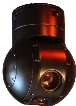
Рисунок 1а. Внешний вид гиростабилизированного подвеса OTUS с телевизионным каналом и лазерным дальномером

В 2009 года Промышленная ассоциация «Мега» вышла на отечественный рынок с аппаратно-программными комплексами серии OTUS (ранее COLIBRI), разработанными компанией DST CONTROL AB (Швеция). Данные системы предназначены для сбора, передачи, анализа и хранения информации с БЛА различных типов. Основу комплекса составляет гиростабилизированный подвес, в котором размещен оптико-электронный блок, содержащий (в зависимости от модели и комплектации) телевизионный канал, тепловизионный канал, лазерный дальномер (Рисунок 1).