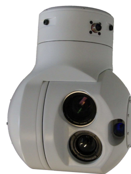
Рисунок 1б. Внешний вид гиростабилизированного подвеса OTUS с телевизионным и тепловизионным каналами