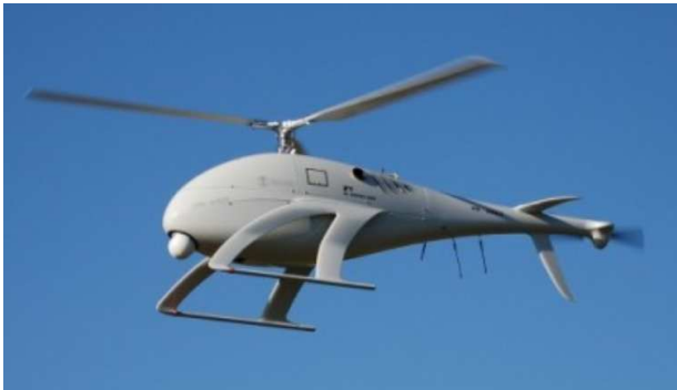
Рисунок 3а. Размещение OTUS на БЛА NEO S-300 производства Swiss UAV GmbH

Модульное исполнение OTUS позволяет подобрать оптимальную конфигурацию для эффективного решения большинства практических задач, связанных с применением БЛА. Миниатюрное исполнение, простота интеграции и монтажа делают данный комплекс совместимым со всеми ЛА, применяемыми для наблюдения и дистанционного зондирования (Рисунок 3).