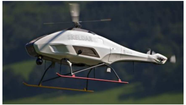
Рисунок 3б. Размещение OTUS на БЛА Skeldar производства SAAB

Следует отметить, что программно-аппаратный комплекс OTUS, включающий в себя программное обеспечение SRVISION, является также мощным инструментом для анализа, хранения и передачи данных, получаемых наблюдательными каналами комплекса. Возможности ведения базы данных, цифровой обработки изображений и видео, отслеживания динамики изменения исследуемого объекта, генерирования пакетов информации в стандарте ITDF (Industrial Testing Digital Format), создания и печати отчётов в различных форматах позволяют говорить о OTUS, как об инструменте автоматизированного проведения полного цикла работ, связанных с авиамониторингом, и минимизировать временные и материальные затраты по его проведению.