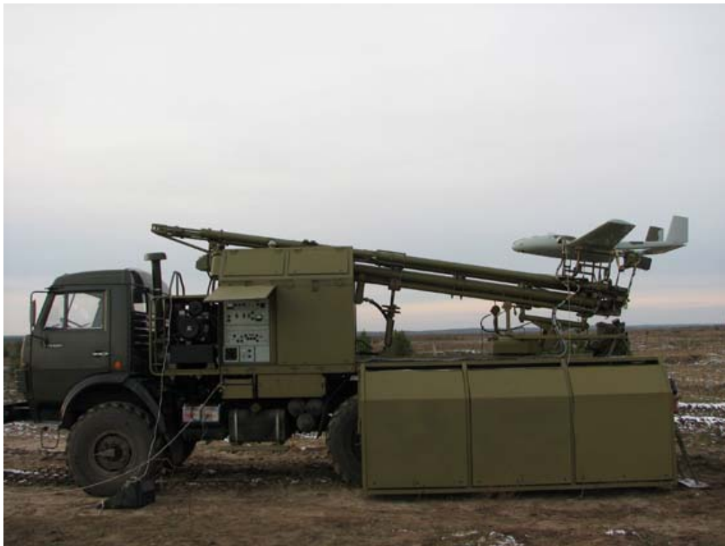
Рисунок 4. БЛА «Типчак» на пусковой катапульте

Кроме того, в данном классе «ЭНИКС» разрабатывает комплекс дистанционного обзора с легким БЛА Т21. Полезная нагрузка – ТВ-камера. Конструкция БЛА позволяет транспортировать его в небольшом контейнере. Существует проект БЛА Т24, предназначенный для дистанционного мониторинга местности и передачи фото- и видеоизображения на наземный КП. Его компоновка аналогична БЛА «Элерон». Полезная нагрузка стандартная – ТВ/ИК система.