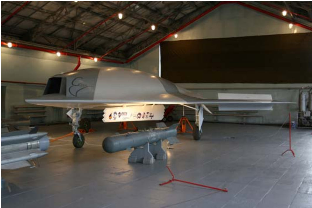
Рисунок 8. ББС «Скат»

Так, ОАО «ОКБ им. А.С. Яковлева» работает над унифицированным семейством тяжелых БЛА «Прорыв». В нем широко используются агрегаты и системы учебно-боевого самолета Як-130. В составе разрабатываемого семейства планируется создать ударный БЛА «Прорыв-У». Аппарат планируется выполнить по малозаметной схеме «летающее крыло» с внутренним размещением боевой нагрузки.