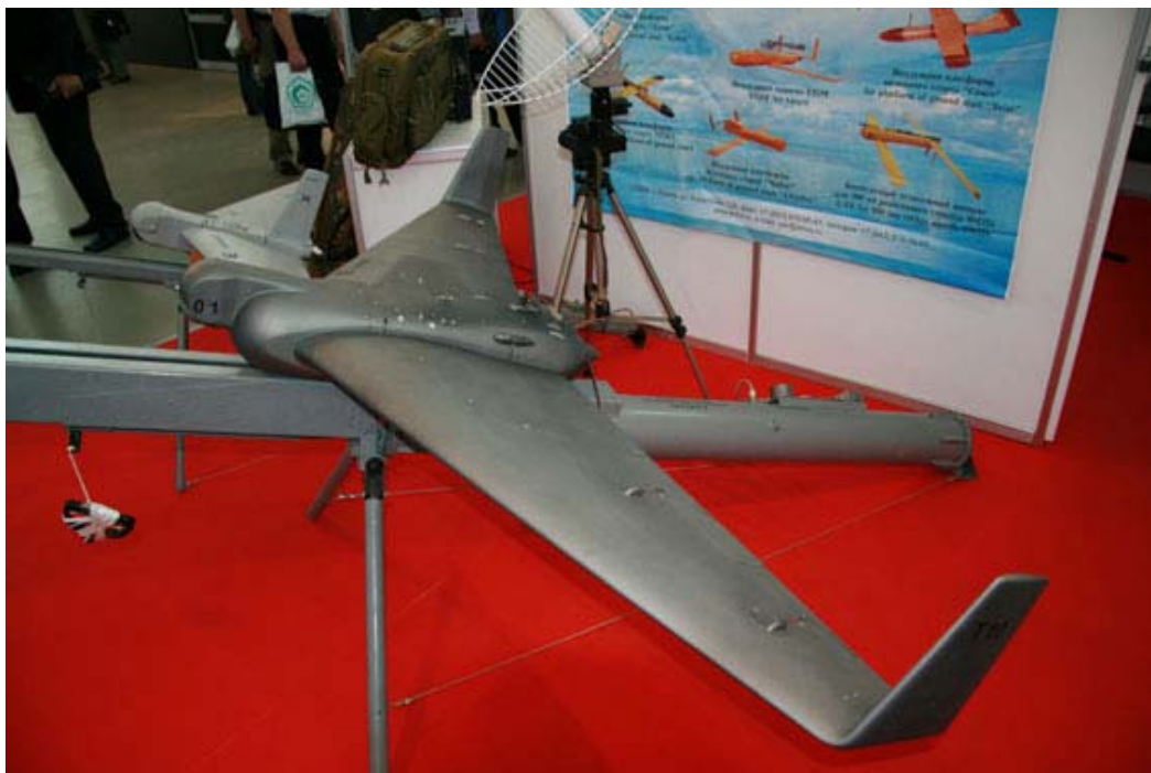
Рисунок 3. БЛА «Элерон-10»

На выставке UVS-TECH 2008 ЗАО «ЭНИКС» впервые объявило о создании на базе беспилотника Т10 двух комплексов мониторинга, адаптированных под конкретные задачи, – «Элерон-10» и «Гамаюн-10». В комплексе «Элерон-10» возможно применение БЛА в нескольких вариантах целевой нагрузки, в том числе с ТВ-, ИК-камерой, фотоаппаратом, ретранслятором, станцией РТР и постановки помех. В 2007-2008 гг. комплекс «Элерон-10» прошел цикл летных испытаний. Похожий аппарат есть и в линейке беспилотников компании «Иркут». Комплекс «Иркут-10» состоит из двух БЛА, наземных средств управления и обслуживания, снабжен линией связи с двумя цифровыми защищенными каналами управления и передачи данных. Готовится серийное производство.