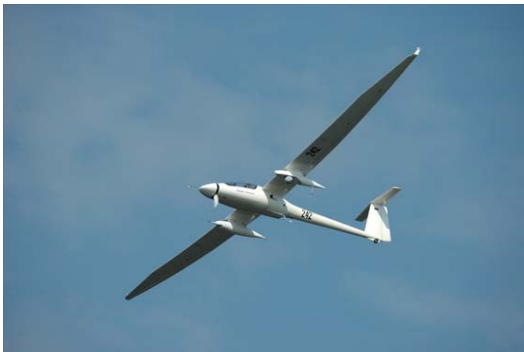
Рисунок 7. БЛА «Иркут-850»

К этому же классу может быть отнесен БЛА Ту-243, входящий в состав комплекса фото- и ТВ- разведки «Рейс-Д». Он является модернизированным вариантом БЛА Ту-143 «Рейс» и отличается от него полностью обновленным составом разведывательного оборудования, новым пилотажно-навигационным комплексом, увеличенным запасом топлива и некоторыми другими особенностями. Комплекс состоит на вооружении ВВС России. В настоящее время предлагается дальнейшая модернизация БЛА в вариантах разведчика «Рейс-Д-Р» и ударного БЛА «Рейс-Д-У». В ударном варианте он может оснащаться обзорно-прицельной системой и СУО. Вооружение может состоять из двух блоков КМГУ внутри грузоотсека. В 2007 г. было объявлено о намерении «реанимировать» проект многоцелевого оперативно-тактического беспилотного комплекса с БЛА Ту-300 «Коршун», предназначенного для решения широкого круга задач разведки, поражения наземных целей и ретрансляции сигналов. Полезная нагрузка – аппаратура радиотехнической разведки, РЛС бокового обзора, фотоаппараты, ИК-камеры или авиационные средства поражения на внешней подвеске и во внутреннем отсеке. Доработка должна, коснуться повышения характеристик и использования нового оборудования. Планируется расширить номенклатуру применяемого вооружения и включить обычные и корректируемые авиабомбы, глубинные бомбы и управляемые ракеты класса «воздух–поверхность».