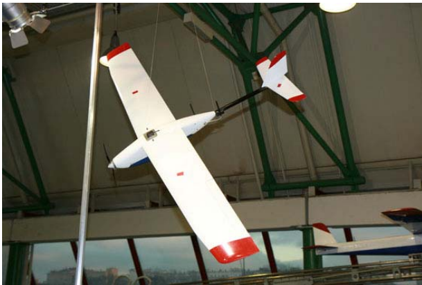
Рисунок 1. БЛА «БРАТ»

Давно известен своими разработками в области беспилотных систем Научно-производственный и конструкторский центр «Новик-XXI век». Одна из разработанных компанией систем – комплекс с БЛА «БРАТ». В его состав входит малоразмерный беспилотный аппарат массой 3 кг. Штатной целевой нагрузкой являются две ТВ-камеры или один цифровой фотоаппарат.