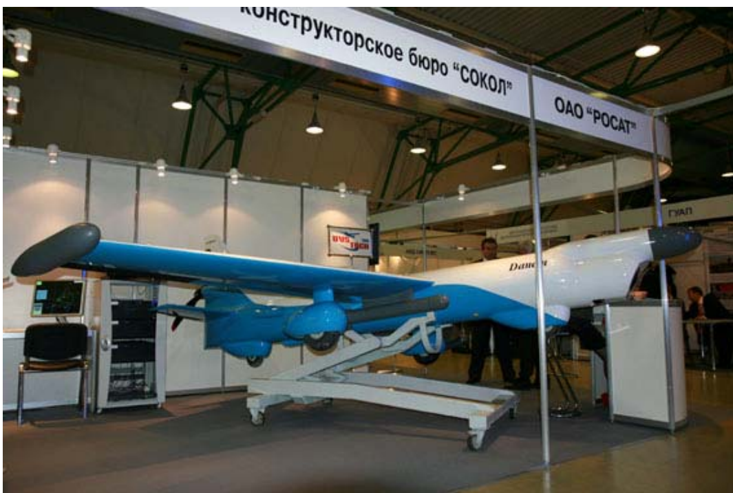
Рисунок 6. БЛА «Данэм»

площади и протяженности над земной и водной поверхностью. В его состав входят БЛА (один или несколько), мобильный наземный пункт управления, а также средства наземного обслуживания. Система управления – комбинированная (программная и радиокомандная). Целевое оборудование – оптико-электронная система с ТВ- и тепловизионным каналами. В настоящее время проект находится в стадии отработки систем. Та же фирма предлагает комплекс беспилотных летательных аппаратов «Дань-Барук», предназначенный для ведения воздушной разведки. Он интересен тем, что обладает возможностью нанесения ударов по отдельным целям. БЛА имеет большую продолжительность полета и высотность. В состав комплекса также входят один или несколько беспилотных аппаратов, мобильный наземный пункт управления, а также средства наземного обслуживания. Полезная нагрузка – обзорно-прицельная система, бортовые средства поражения (два контейнера с самоприцеливающимися и кумулятивно-осколочными боевыми элементами). Реализация проекта находится в стадии ОКР.