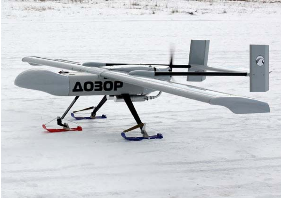
Рисунок 5. БЛА «Дозор-4»

К рассматриваемому классу относится и достаточно старый комплекс «Строй-П» разработки московского НИИ «Кулон» с БЛА «Пчела-1Т». В настоящее время комплекс модернизирован («Строй-ПД») в части круглосуточного применения. Кроме того, в перспективе в его состав предполагается введение других БЛА.