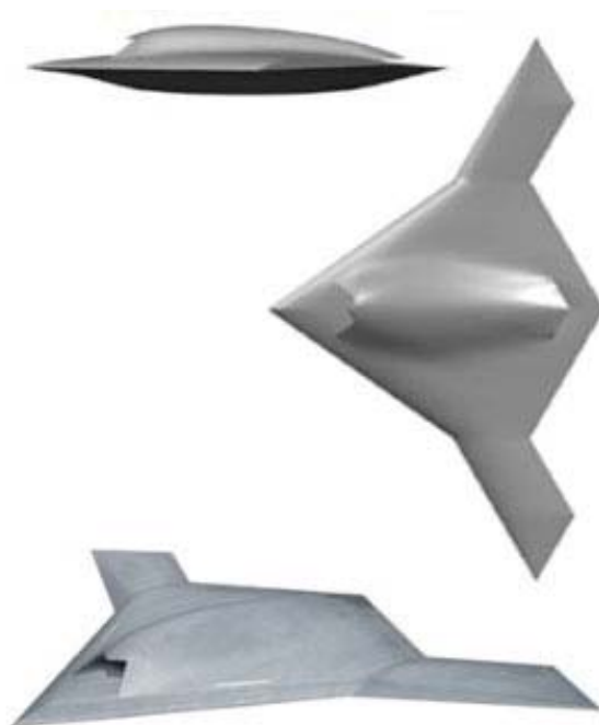
Рисунок 4. БЛА X-47B

Следует отметить, что существующие разработки США в значительной степени исходят из требования США к размерности ударных БЛА в соответствии с концепцией применения в составе мобильных экспедиционных сил. Подход европейских стран в большей степени исходит из условий применения на континентальных ТВД, что отражается на размерности исследуемых вариантов ударных БЛА, которые меньше американских, хотя окончательные требования к ударным БЛА европейские Минобороны еще не сформулировали.