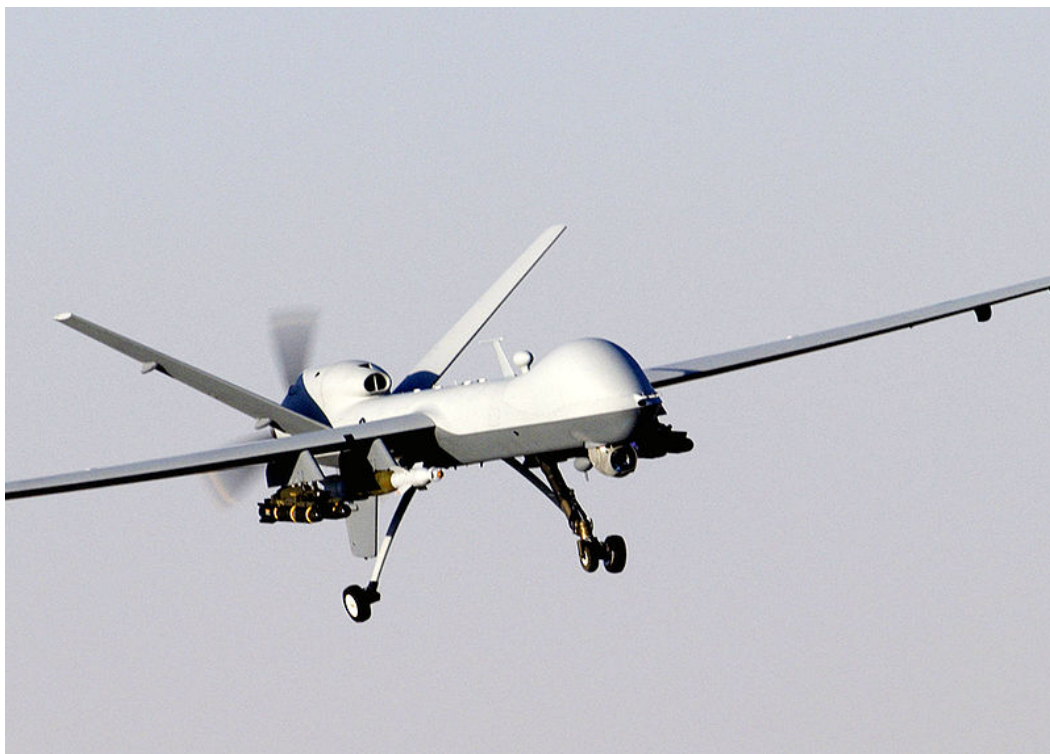
Рисунок 2. БЛА Reaper (Predator B)

Первый – это БЛА типа Predator-B MQ-9 (Reaper), являющийся развитием разведывательного БЛА, оснащенный вооружением ограниченной номенклатуры и боевых возможностей. Исходя из этого, комплекс может скорее всего рассматриваться для ведения разведывательно-ударных действий в ограниченных локальных конфликтах (типа конфликта в Ираке) при наличии превосходства в воздухе. В условиях огневого противодействия противника вероятно применение этого БЛА будет носить ограниченный характер по причине недостаточной выживаемости.