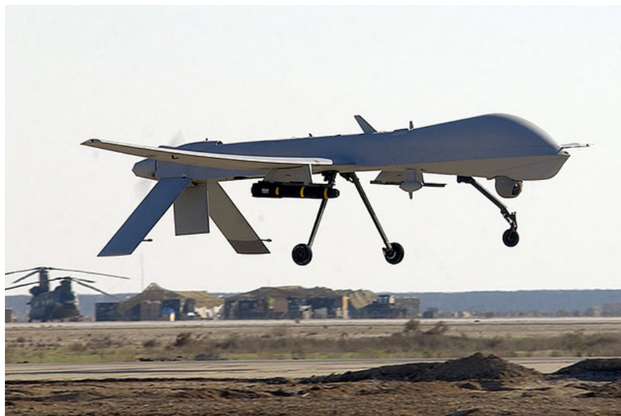
Рисунок 1. БЛА Predator в 2005 году уничтожил одного из лидеров «Аль-Каиды»

Беспилотные системы нашли свое применение и в контртеррористических операциях. Именно американский беспилотник Predator уничтожил в 2005 году на пакистано-афганской границе одного из лидеров «Аль-Каиды» Хайтама аль-Йемени.