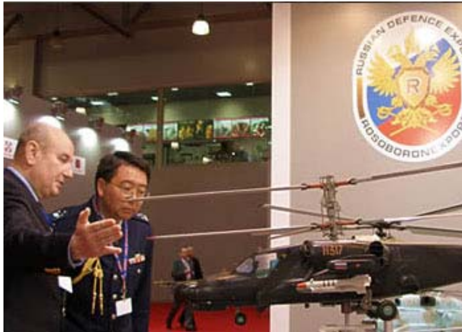
Рисунок 3. Возможно, в недалекой перспективе на стендах Рособоронэкспорта появятся и отечественные беспилотники

При их создании используются передовые отечественные технологии и оригинальные технические решения. В последние годы особое внимание российские разработчики уделяют внедрению цифровых технологий, например автоматизации разработки полетных заданий, выполнению полетов в автономном режиме с использованием данных спутниковых систем навигации, автоматизированным сбору и обработке информации.